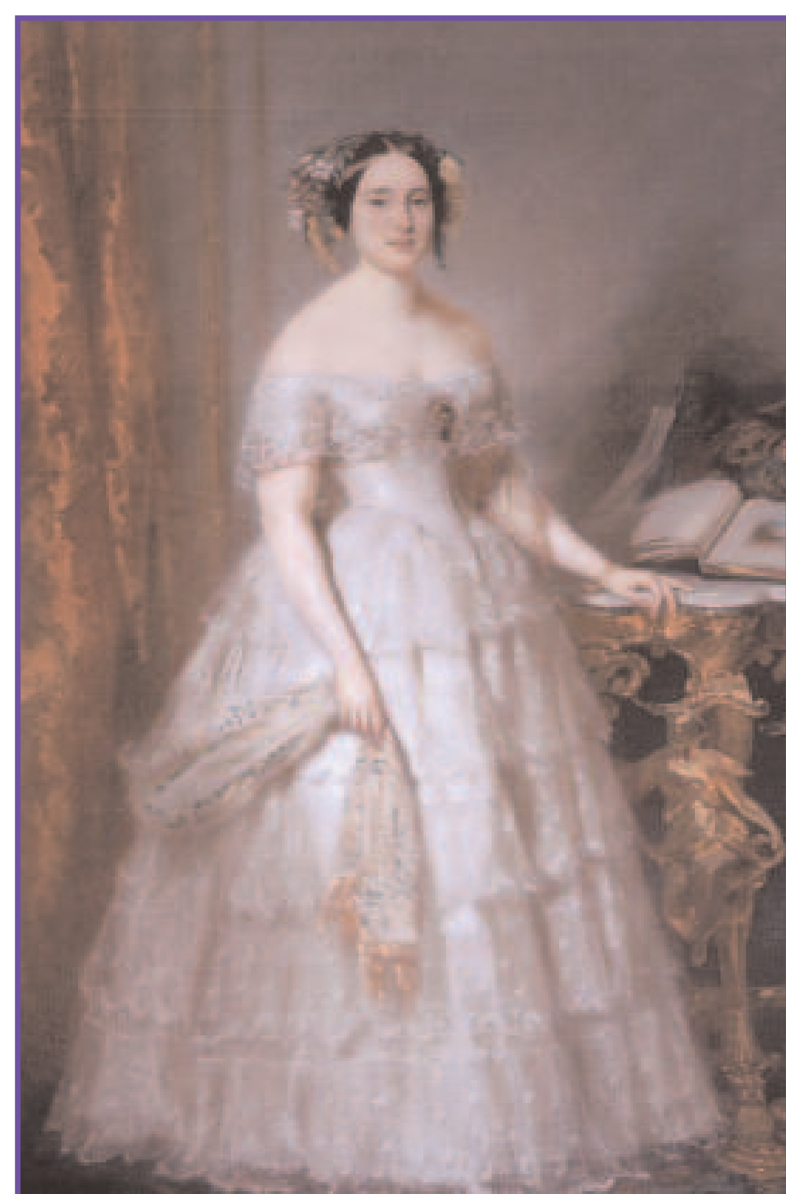
Mathilde Bonaparte par Eugène Giraud (fin XIX e S.)