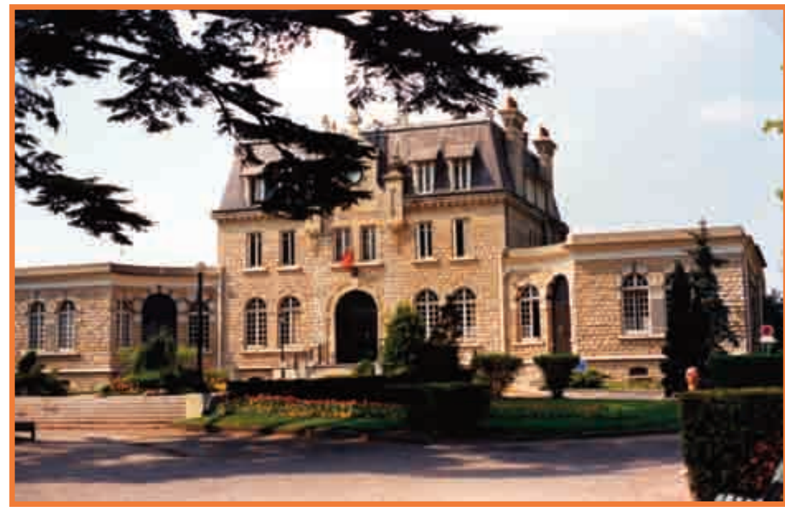
Mairie actuelle - 2009

Au fil du temps, l'agrandissement de la mairie devient nécessaire : en 1936 deux ailes lui sont adjointes ce qui lui confère l'aspect que nous lui connaissons aujourd'hui.