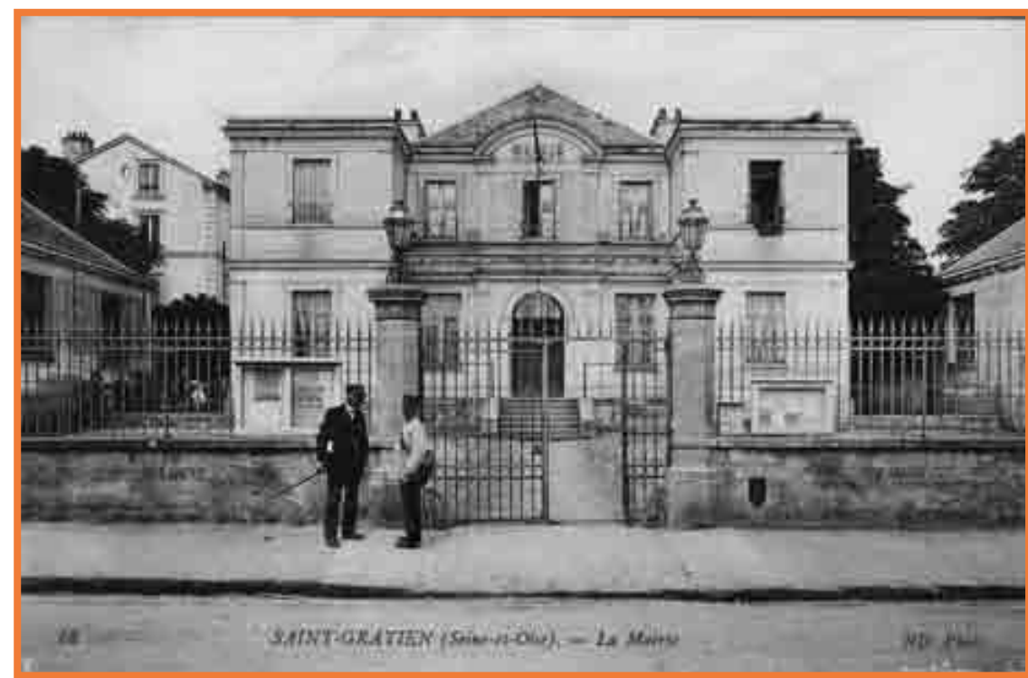
Première mairie - 1869

Ce n'est qu'en 1869 que la commune achète un terrain en contrebas de l'église pour y faire ériger un bâtiment à vocation unique : une mairie.