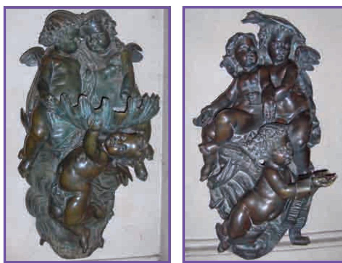
Bénitier et tronc d'Hélène Bertaux (1857)

L'église recèle nombre d'œuvres dont certaines sont inscrites à l'inventaire des monuments historiques. Outre le tombeau du Maréchal Nicolas de Catinat figurent également le buste de la Princesse Mathilde Bonaparte qui lui fait face, les tronc et bénitier d'Hélène Bertaux offerts par Napoléon III, les 14 Stations du Chemin de Croix ou encore les vitraux ornés des mécènes qui ont aidé à la construction de l'édifice.