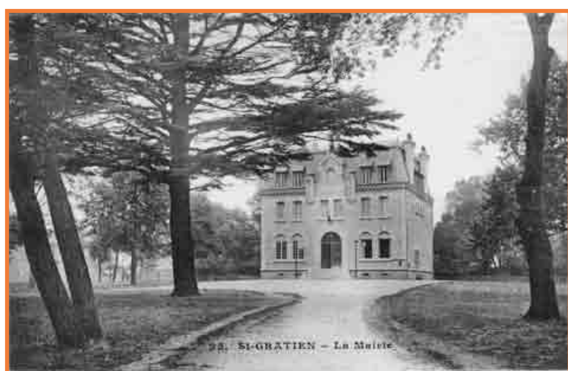
Mairie actuelle - 1909

Inaugurée le 7 février 1909, son style architectural est celui d'une maison bourgeoise du XIX ème siècle.