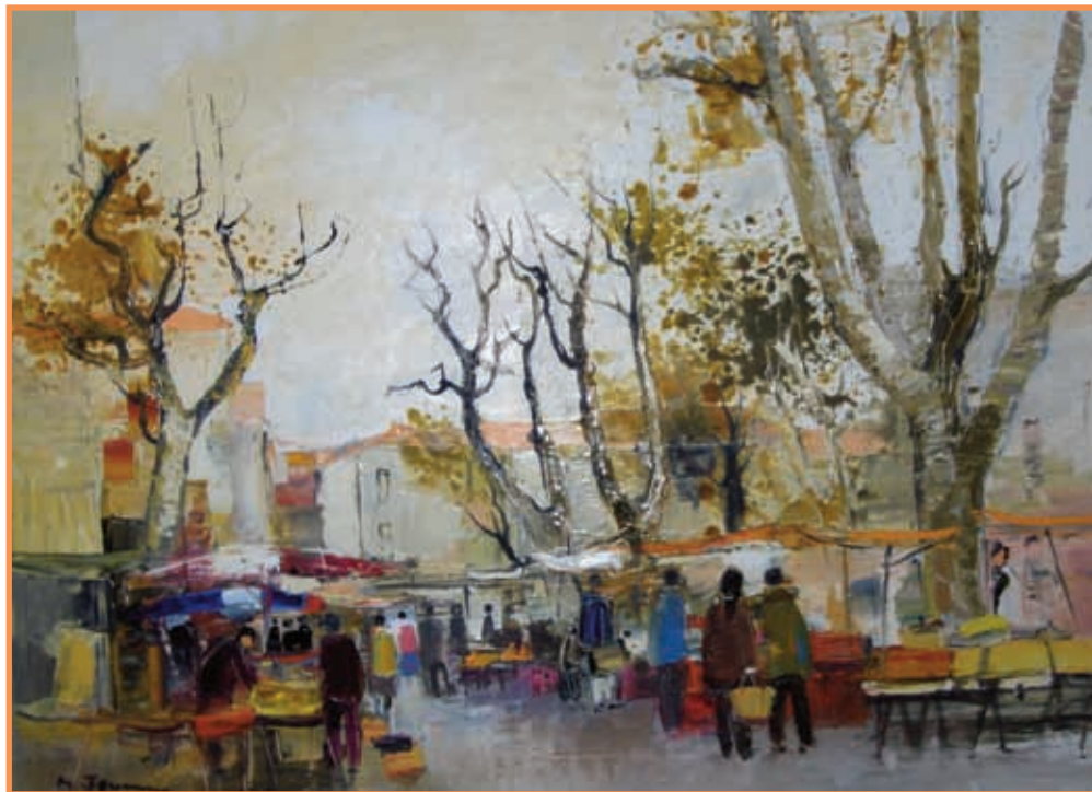
DAC 22 «LE MARCHÉ EN PROVENCE» Michel JOUENNE Huile sur toile 76 x 100 cm