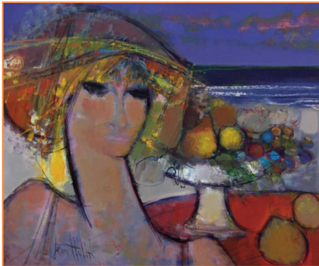
DAC 21 «FEMME ET FRUIT» Jean HULIN Huile sur toile 64 x 77 cm