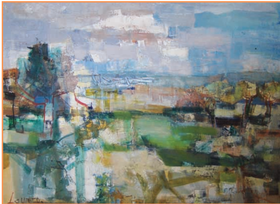
DAC 16 «PAYSAGE A BELLOY» Albert LAUZERO Huile sur toile 54 x 73 cm