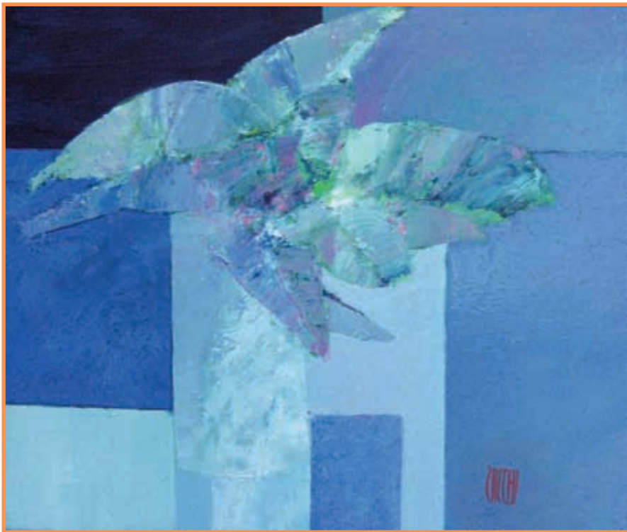
DAC 13 Sans titre Jean-Marie ZACCHI Huile sur toile 47 x 56 cm