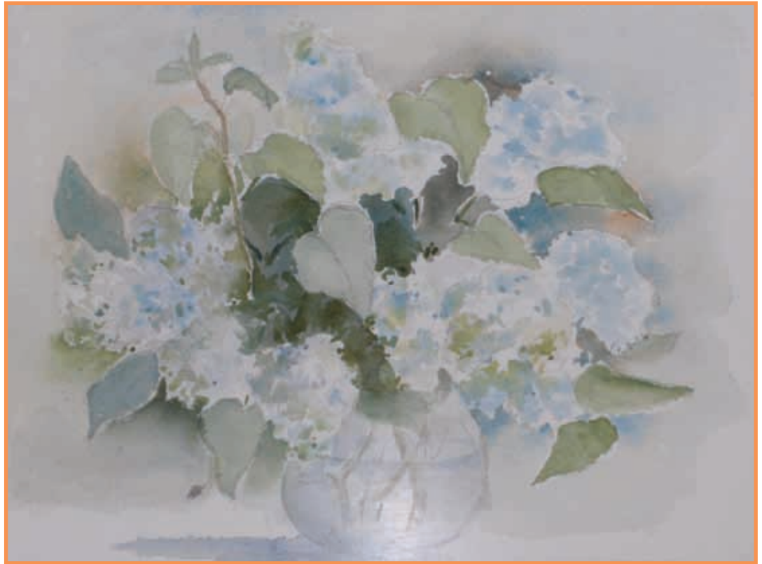
DAC 11 (BOUQUET) Geneviève BEAU Aquarelle 29 x 39 cm