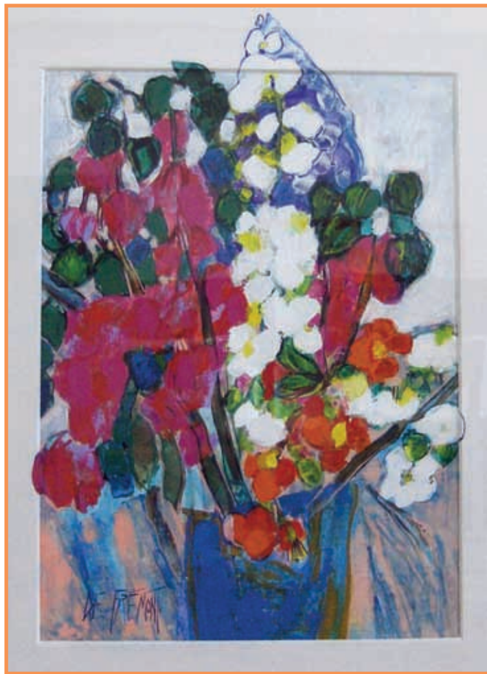
DAC 30 «LES FLEURS MAGENTA» Andrée de FREMONT Acrylique sur papier 60 x 80 cm