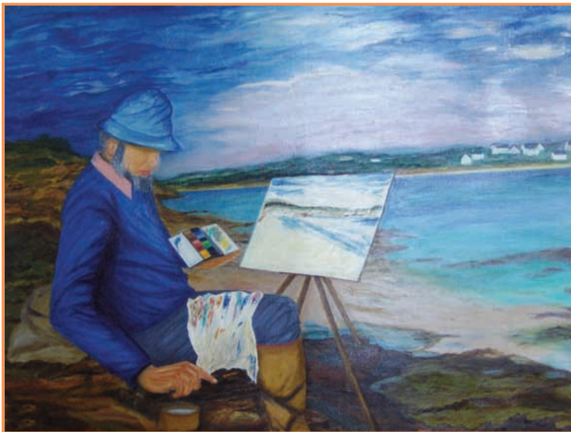
DAC 26 «L'AQUARELLISTE JEAN HULIN» Bernard FOUCHET 1982 Huile sur toile 93 x 127 cm