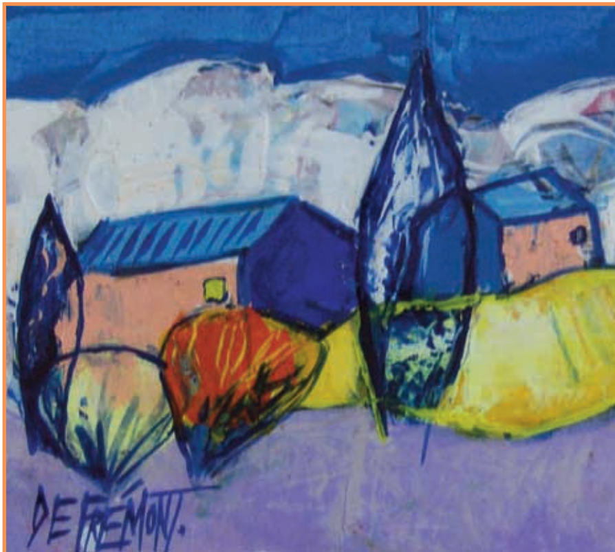
DAC 5 (PROVENCE) Andrée de FREMONT Huile sur toile 13 x 12 cm