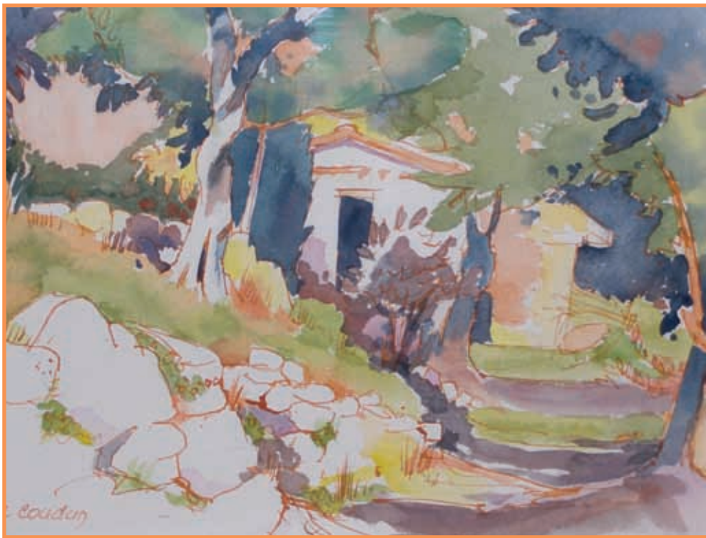
DAC 12 «RESTANQUE À GRASSE» Jean-Claude COUDUN Aquarelle 26 x 34 cm