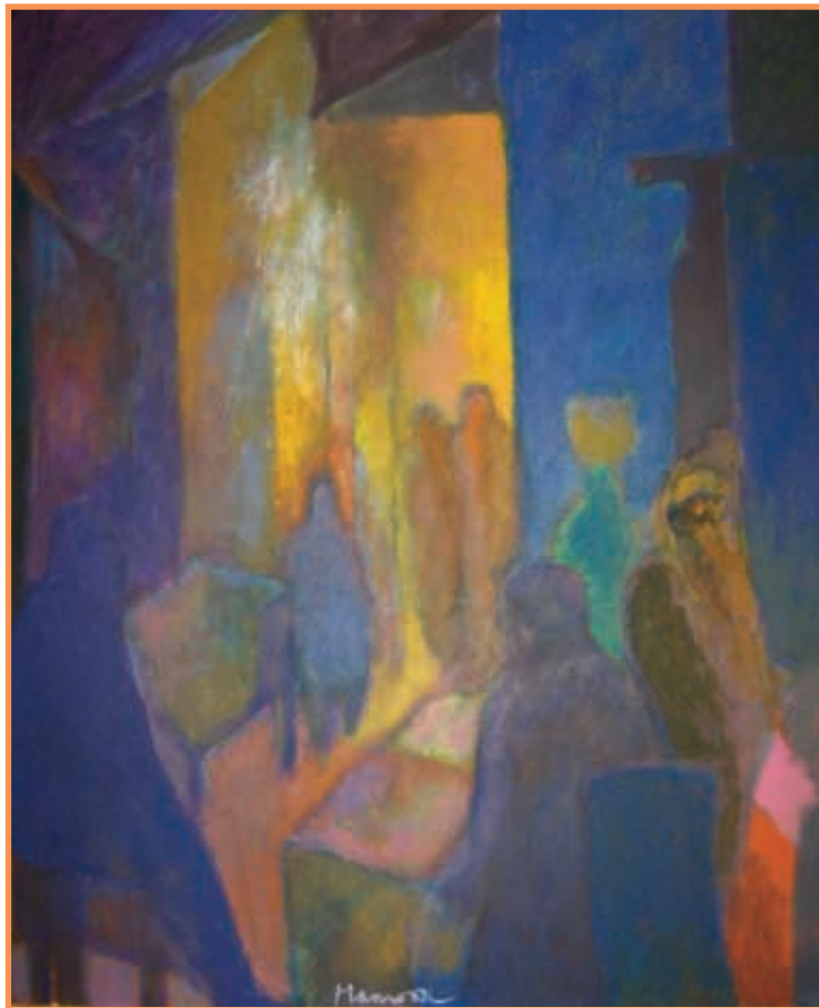
DAC 19 «RENCONTRE» Anwar MAMDOUCH 5 septembre 2001 - Paris Huile sur toile 60 x 73 cm