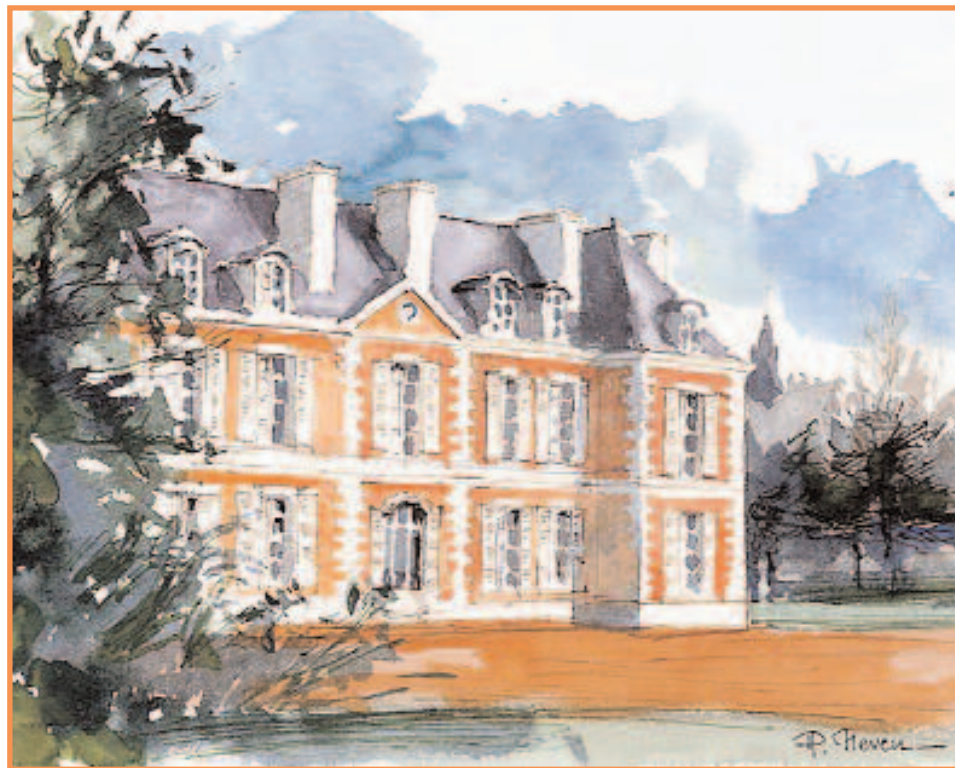
DAC 33 «LE CHATEAU CATINAT » Pierre NEVEU Aquarelle 21 x 17 cm