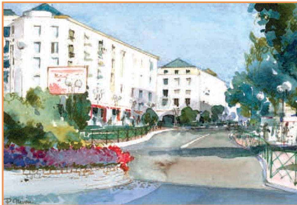
DAC 32 «VOEUX DU MAIRE 2004» Pierre NEVEU Aquarelle 31 x 21,5 cm