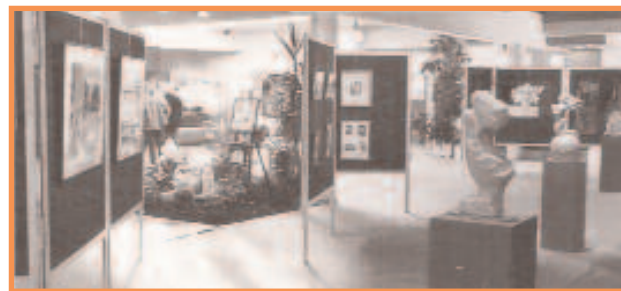
Centre culturel du Forum 1 ère Biennale de la Princesse Mathilde (10-19 mars 1995)

Ainsi, plus que jamais, l'art occupe une place à part entière à Saint Gratien.