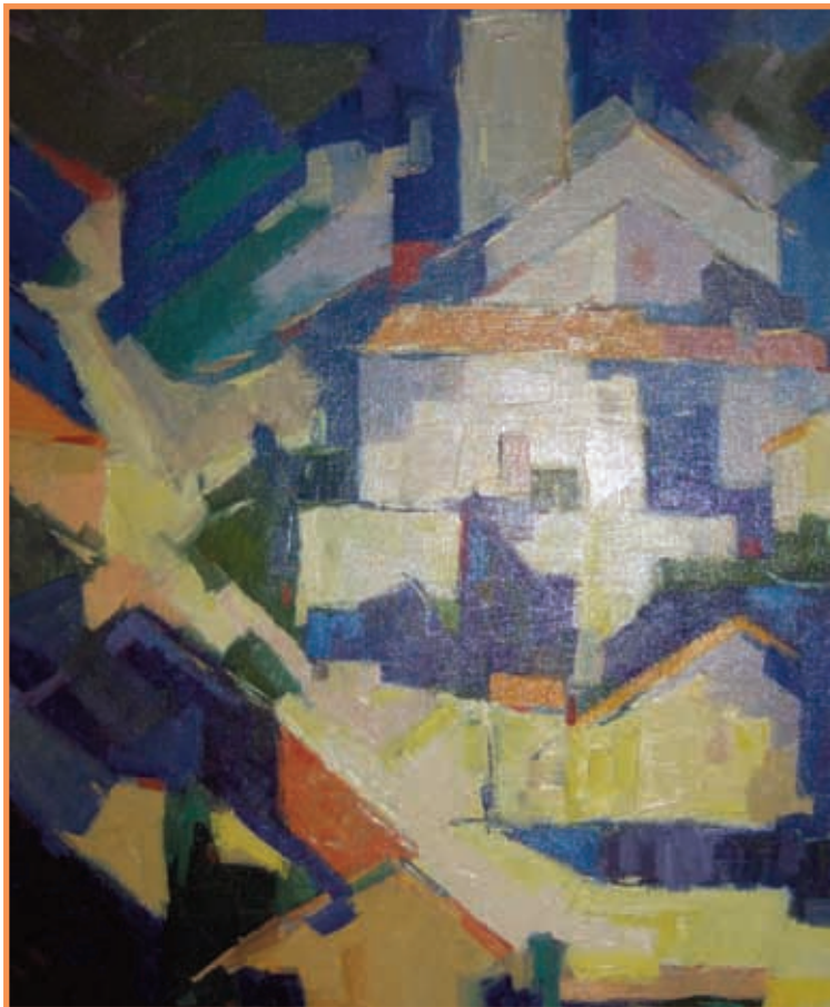
DAC 14 Sans titre J.-N. GERALD 1984 Huile sur toile 52 x 63 cm