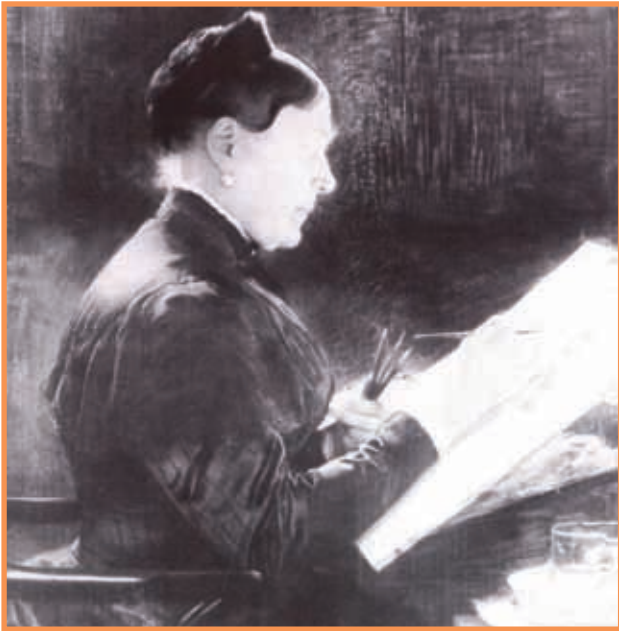
Photographie de Raoul Saisset (1895) de l'aquarelle de Doucet représentant la Princesse Mathilde peignant.