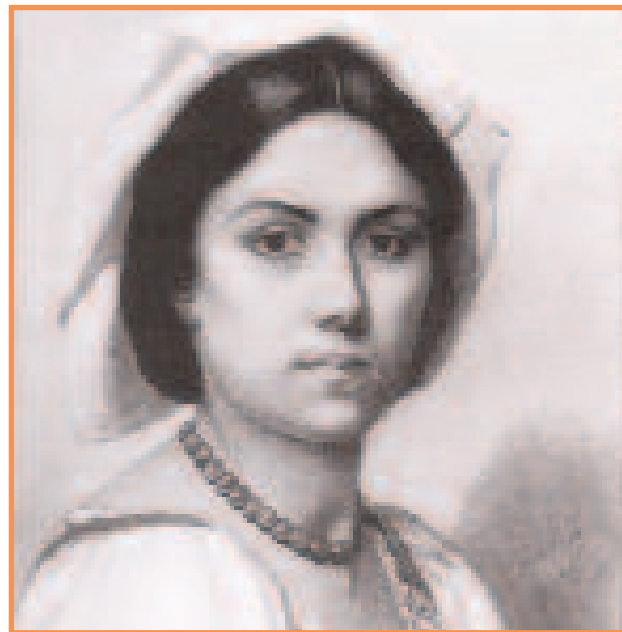
Jeune Italienne , aquarelle réalisée par la Princesse Mathilde, Paris, Musée national Ernest Hébert

C'est en accueillant ses amis artistes dans sa maison et son salon de Saint Gratien, en qualité de "Dame des Arts" et de mécène, que la Princesse Mathilde transmet en héritage à notre Ville son goût pour les arts et particulièrement pour la peinture.