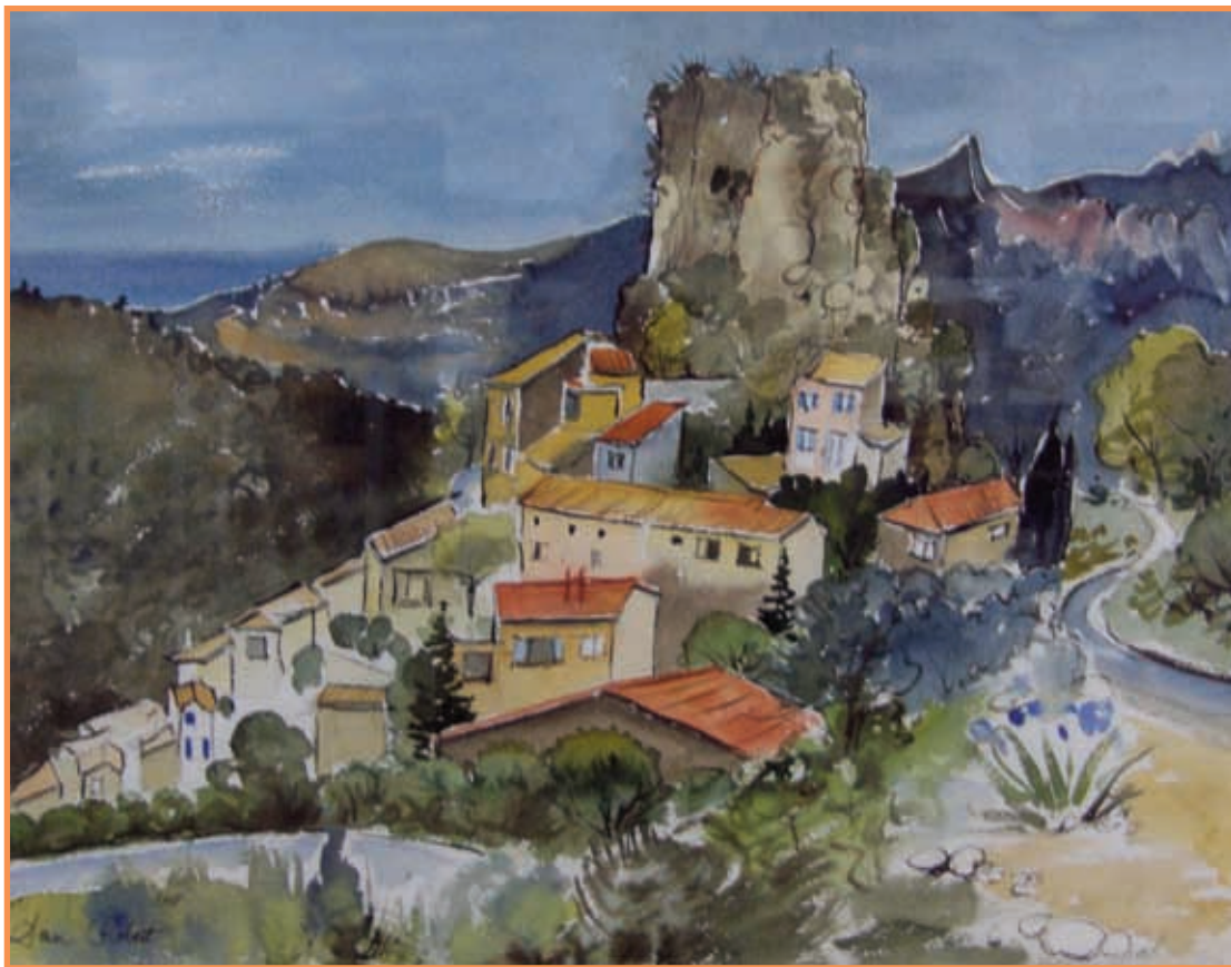
DAC 31 «LA ROQUE ALRIC» Dan ROBERT Aquarelle 68 x 51 cm