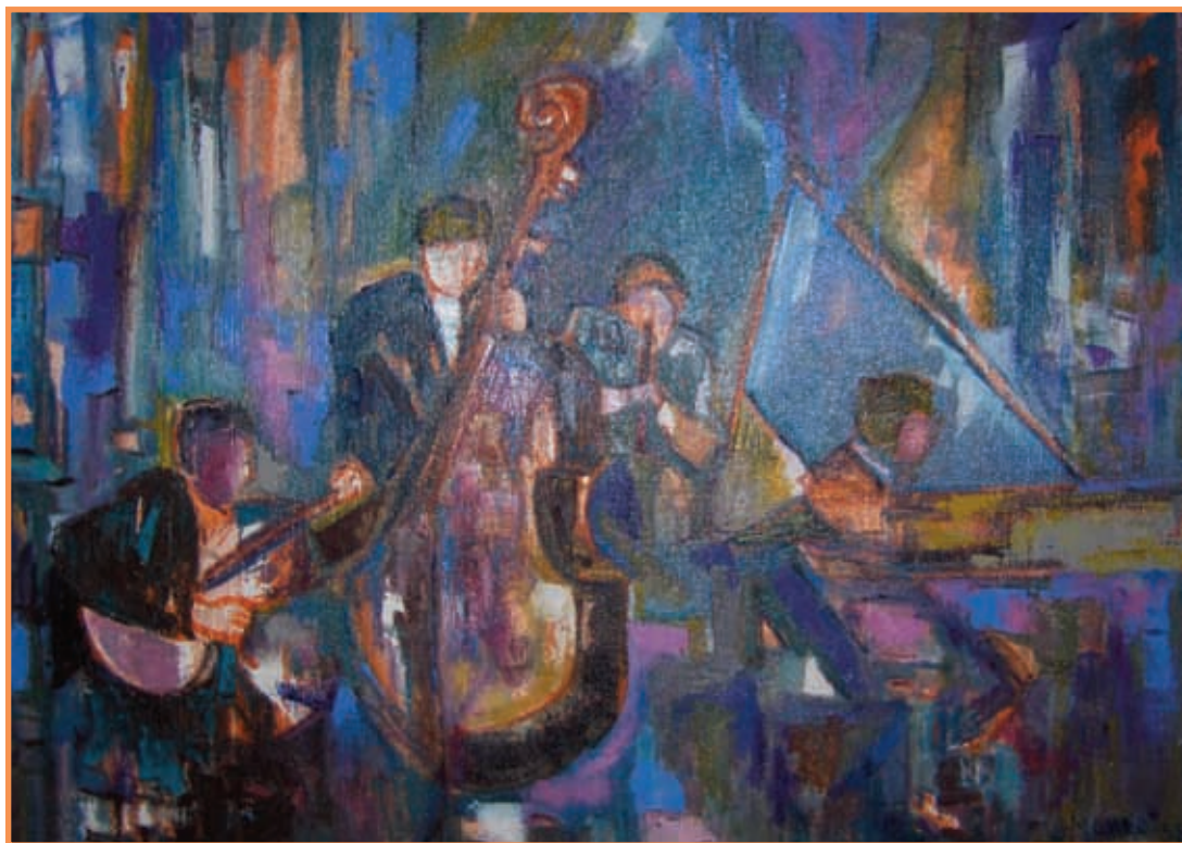
DAC 25 «MUSIQUE DE NUIT» Madeleine MONNET Huile sur toile 65 x 92 cm