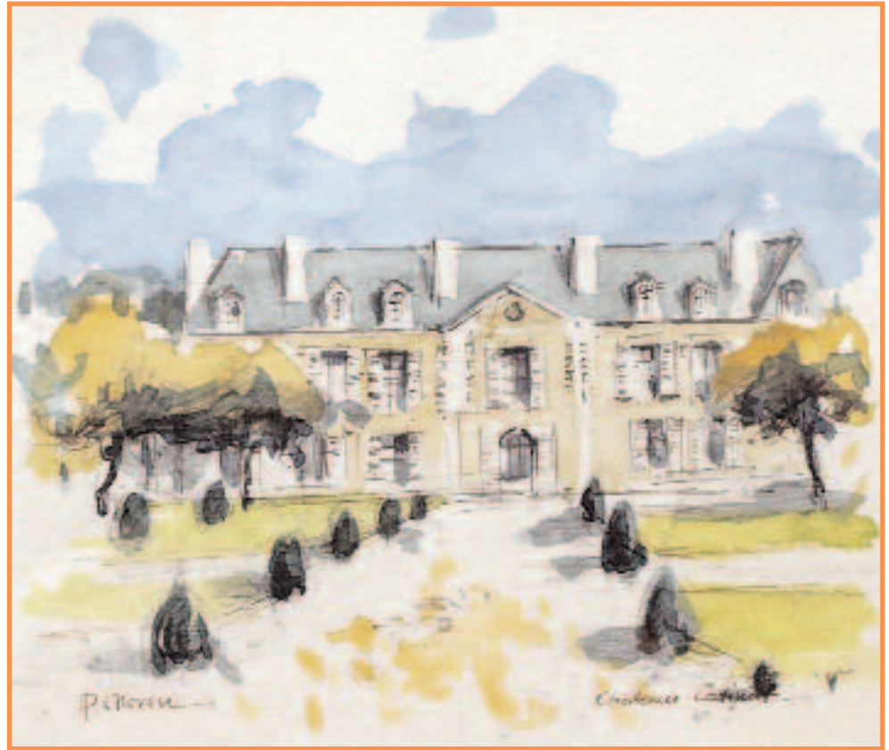
DAC 34 «LE CHATEAU CATINAT» Pierre NEVEU Aquarelle 15 x 14 cm