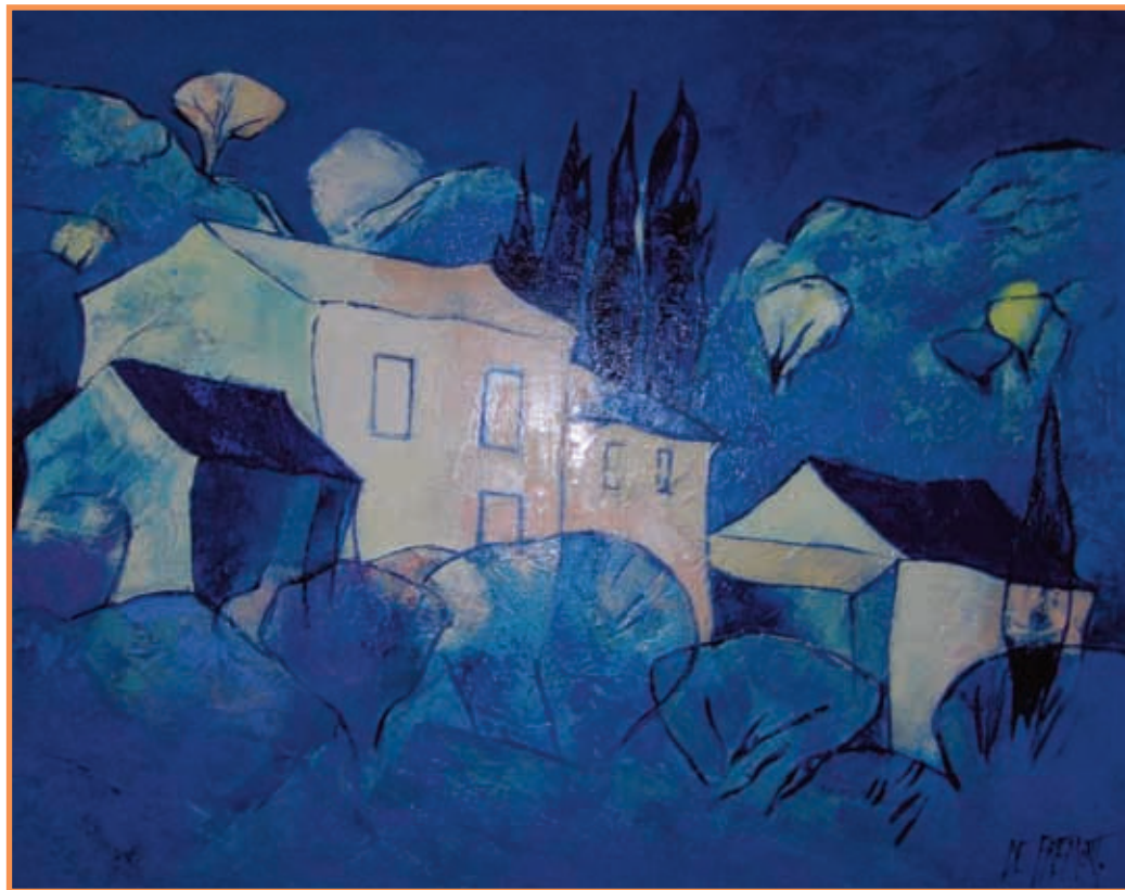
DAC 23 «LE MAS DES CHALANS» Andrée de FREMONT Huile sur toile 73 x 92 cm