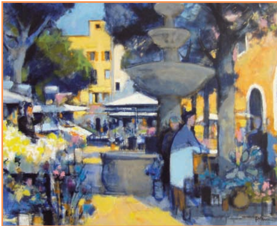
DAC 24 «MARCHE AUX FLEURS DE GRASSE » Pierre NEVEU Huile sur toile 64 x 80 cm