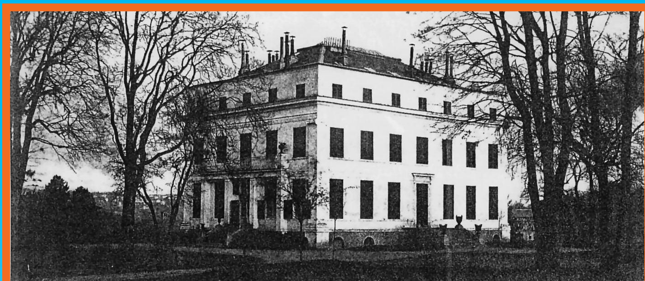
Le château Neuf en 1854-1855 (collection particulière).

1904 : au décès de la Princesse, le château revient au Prince Napoléon son neveu qui