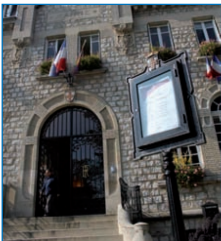
Les permanences du Maire sont affichées devant l'Hôtel de Ville

Les prochaines permanences du Maire auront lieu à l'Hôtel de Ville, le lundi 15 novembre à 17h pour « sociale & logement » et le lundi 22 novembre à 17h pour « le Maire est à votre écoute ». Prendre rendez-vous le matin même, exclusivement par téléphone, au 01 30 10 91 50.