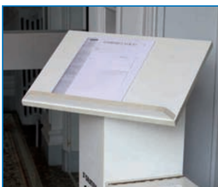
La boîte "Exprimez-vous" est dans le hall d'accueil de l'Hôtel de Ville

Située à l'accueil de l'Hôtel de Ville, la Municipalité met à votre disposition une urne afin de vous exprimer. N'hésitez pas à communiquer vos avis, remarques et suggestions relatifs à la vie de votre commune. Indiquez vos nom, prénom et adresse afin que le Maire puisse vous répondre.