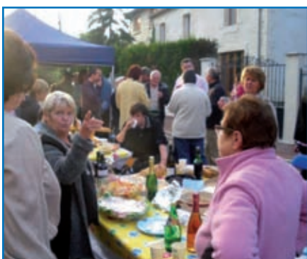
La fête des voisins