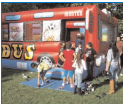
L' école de la route