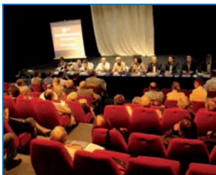
Assemblée Consultative de Quartier

L'assemblée consultative de quartier invite toute la population de Saint Gratien à s'investir dans la vie locale à l'occasion de deux réunions annuelles par quartier. En effet, l'articulation de la gestion de l'espace urbain, des équipements publics, l'écoute et la participation des habitants, l'animation et les débats, contribuent au développement du lien social et à la dynamique de gestion urbaine de proximité dans laquelle s'est engagée la commune.