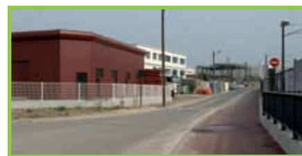
La rue de l'Avenir

Par ailleurs, l'installation des caméras de vidéo-protection par la CAVAM reliées à un Centre de Sécurité urbaine sur l'ensemble des pôles commerciaux de la ville, a permis de renforcer la sécurité des usagers et des commerçants.